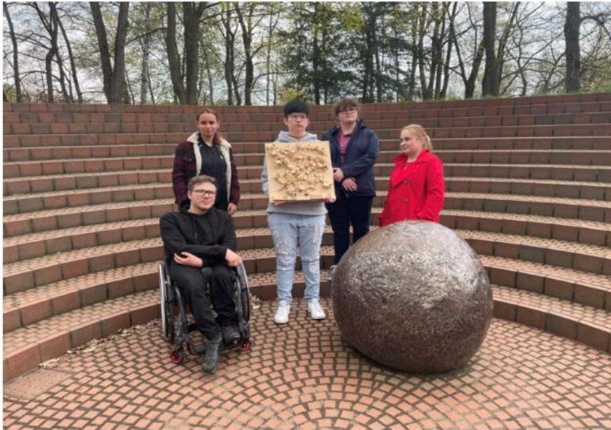
Fünf Teilnehmer:innen der Berufsvorbereitenden Bildungsmaßnahme (BvB) stehen neben der Metallkugel im Gedenken und zeigen ihr fertiges Kunstwerk. Im Hintergrund sieht man die Stufen des Gedenkens.