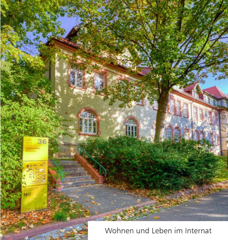
Wohnen und Leben im Internat

Bei Bedarf können Sie bei uns Mobilität, Punkt-schrift und Alltägliches erlernen und trainieren. Die BTG kann als eigenständige Maßnahme