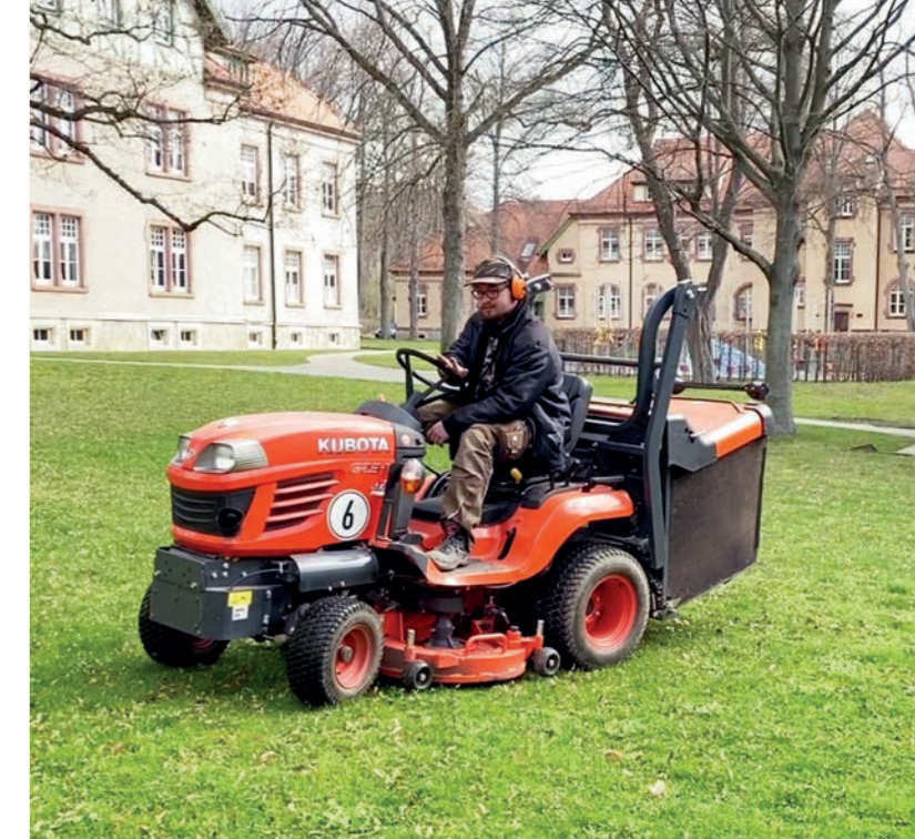
Ausbildungsbereich Garten- und Landschaftsbau